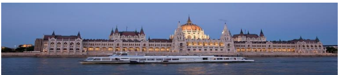
วิศวกรชาวอังกฤษ เหล็กทุกชิ้นที่ใช้ในการสร้างได้นำมาจากประเทศอังกฤษเช่นกัน

นำท่านเดินทางสู่ กรุงบูดาเปสต์ (Budapest) เมืองหลวงของประเทศฮังการี ซึ่งได้ชื่อว่าเป็นเมืองที่ทันสมัยและสวยงามด้วยศิลปวัฒนธรรมของชนหลายเชื้อชาติที่มีอารยธรรมรุ่งเรืองมานานกว่าพันปี ถึงกับได้รับการขนานนามว่าเป็น "ไข่มุกแห่งแม่น้ำดานูป" จากนั้นนำท่าน ล่องเรือแม่น้ำดานูป (Danube Cruises) อันลือชื่อ ชมความงามของทิวทัศน์และอารยธรรมของฮังการีในช่วง 600-800 ปีมาแล้ว ที่ตั้งเรียงรายกันอยู่ 2 ฝากฝั่ง "บูดา" และ "เปสต์" ชมความตระการตาของอาคารต่างๆ อาทิ อาคารรัฐสภา (Orszaghaz) ซึ่งงดงามเป็นที่รำลึกด้วยสถาปัตยกรรมแบบโกธิค บนตัวอาคารประกอบด้วยยอดสูงถึง 365 ยอด นอกจากนี้ท่านจะได้ชมสะพานเซน สะพานถาวรแห่งแรกที่สร้างข้ามแม่น้ำดานูป โดยนาย William Tierney Clark